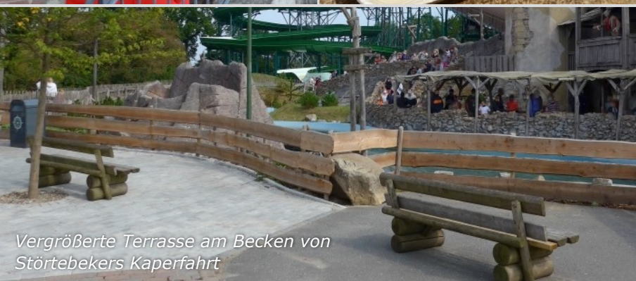
Vergrößerte Terrasse am Becken von Störtebeckers Kaperfahrt