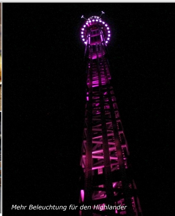
Mehr Beleuchtung für den Highlander