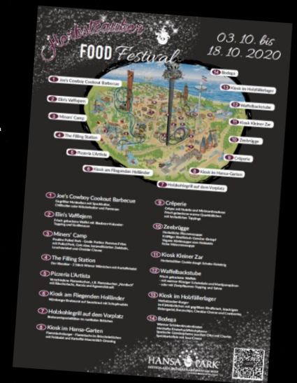
Über die Saison schritt der 8. Hansebauabschnitt gut voran (oben links). Das Holstentor beim Herbstzauber Light (unten), ohne Parade und Feuerwerk, dafür mit neuen Projektionen (oben rechts) und Food Festival.

Am 3. Oktober startete dann der Herbstzauber Light mit neuen Laserobjekten auf dem Wasserfall der Blumenmeerbootsfahrt und dem Kärnan-Turm, sowie einer Projektionsshow auf den Fassaden am Kungstorget. Insbesondere die erste Eventwoche regnete es stark und führte zu einem leeren Park. Sonnig und kühl präsentierten sich die letzten drei Öffnungstage und der Park war nochmals ausgebucht. Am 18. Oktober endete die Saison 2020.