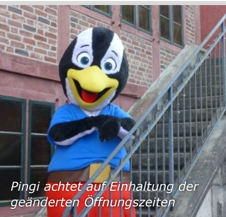
Pingi achtet auf Einhaltung der geänderten Öffnungszeiten