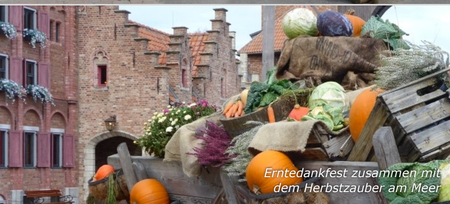
Erntedankfest zusammen mit dem Herbstzauber am Meer