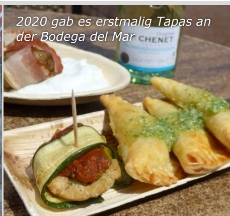
2020 gab es erstmalig Tapas an der Bodega del Mar