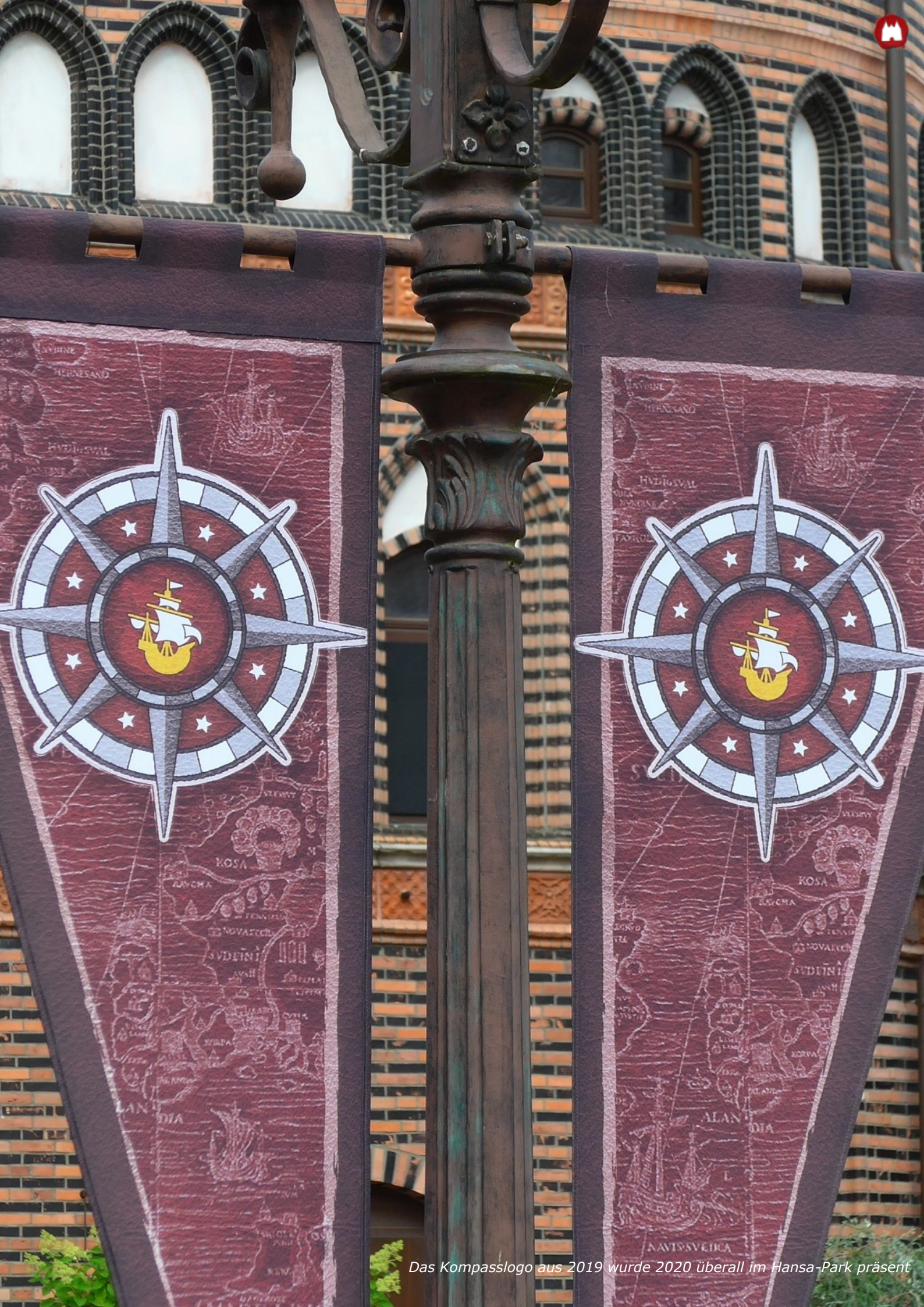
Das Kompasslogo aus 2019 wurde 2020 überall im Hansa-Park präsent